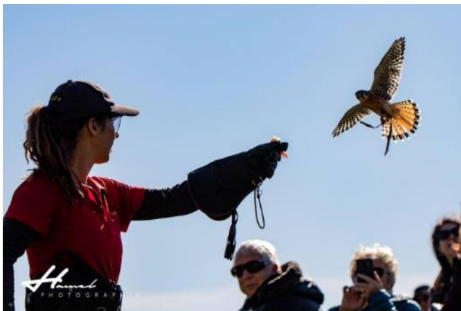
Lot #106 : demi-journée d'entraînement