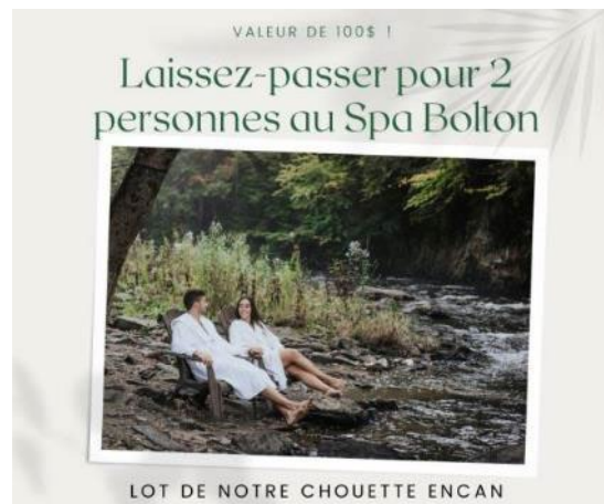
Lot #112 : Laissez-passer pour 2 au SPA Bolton